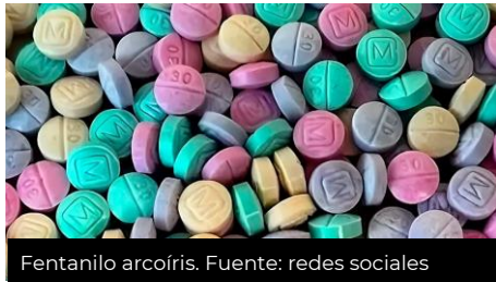
Fentanilo arcoíris.