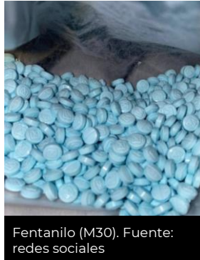
Fentanilo (M30).