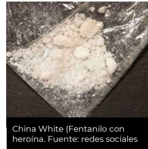
China White (Fentanilo con heroína.